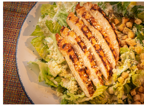
Chicken Cesar Salad 特製チキンシーザーサラダ ¥1,100

グリルチキンに自家製チヨリソーとチーズをかけてオープンでこんがり焼きあげました。フラワートルティージャに巻いてお楽しみください！