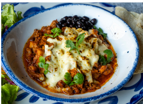
Choripollo チキンと Chorizo のチーズ焼き ¥1,200

グリルチキンに自家製チヨリソーとチーズをかけてオープンでこんがり焼きあげました。フラワートルティージャに巻いてお楽しみください！