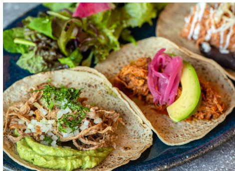
Today's 3 types of Tacos 本日の3種タコスセット ¥1,200

フラワートルティージャに自家製スパイスミックスでマリネしたポークとパインナップ、たっぷりのチーズを挟んで香ばしく焼き上げた、メキシコ版おみじ!?