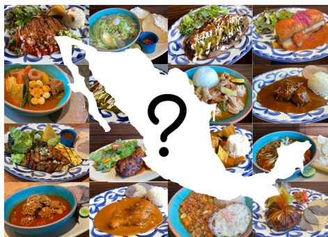
Today's Mexican plate スージーの日替わりメキシカンプレート ¥1,300

柔らかいロース肉を唐辛子やスパイスでマリネしグリルで香ばしく焼き上げた、トゥデイズで人気の品がメニューに仲間入り！