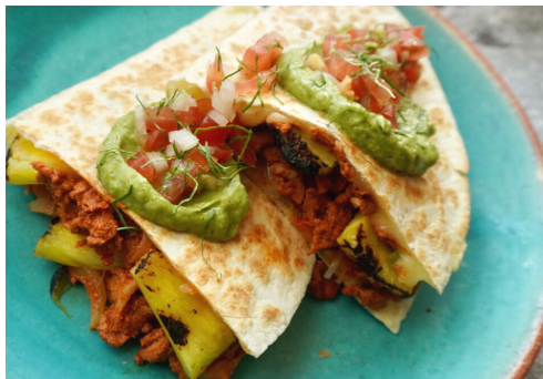
Grilld spicy pork Quesadilla スパイシーポークケサディージャ ¥1,200

フラワートルティージャに自家製スパイスミックスでマリネしたポークとパインナップ、たっぷりのチーズを挟んで香ばしく焼き上げた、メキシコ版おみじ!?