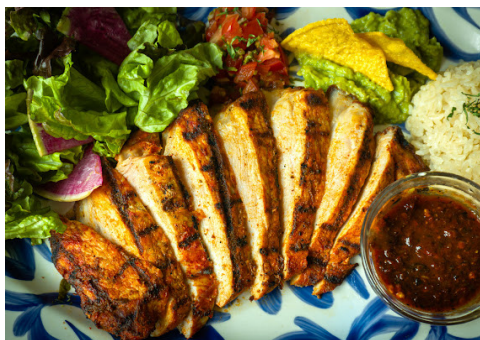
Mexican marinade grilled pork メキシカングリルポーク ¥1,300

柔らかいロース肉を唐辛子やスパイスでマリネしグリルで香ばしく焼き上げた、トゥデイズで人気の品がメニューに仲間入り！