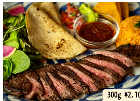
Mexican Beef Steak メキシカンビーフステーキ 200g ¥1,600

人気のフェアがメニューに！メキシコ産ハラミを特製マリネに漬け、グリルでジューシーに焼き上げました。お好きなグラムをお選びください。