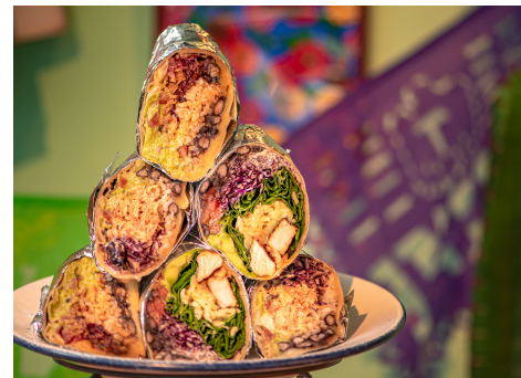
Today's Burrito 本日のプリト ¥ASK

その日のおすすめタコス3種類をご用意！自家製コーントルティージャを使用した、こだわり本格派メキシカンタコスです。